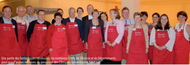
Une partie des fantastiques bénévoles : de nombreux Chefs de Services et de Départements ainsi que d'autres membres du personnel des Cliniques universitaires Saint-Luc