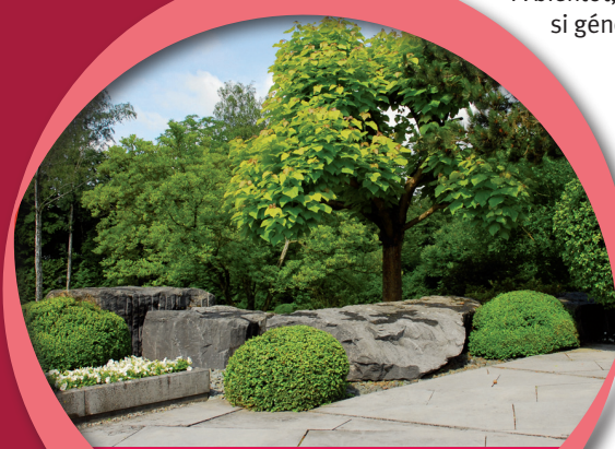
Visite des jardins privés